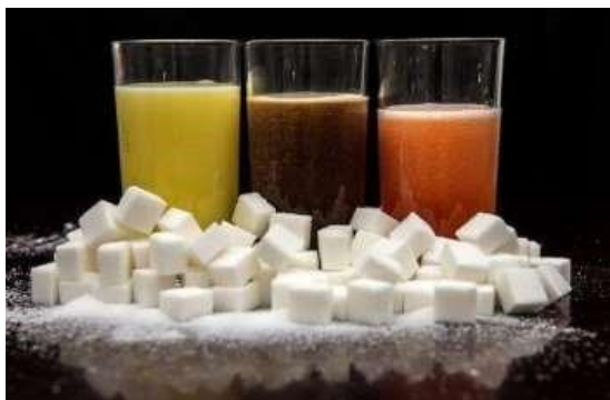
Foto 1. Karastusjookides on palju suhkrut 4